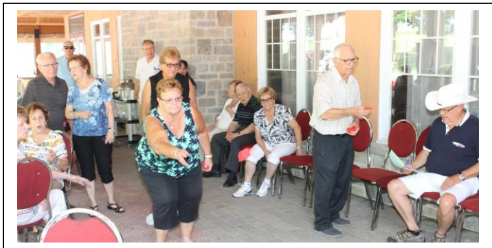
Tournoi de poches

Le Méchoui a réuni 77 personnes qui ont bien mangé et se sont bien amusées.