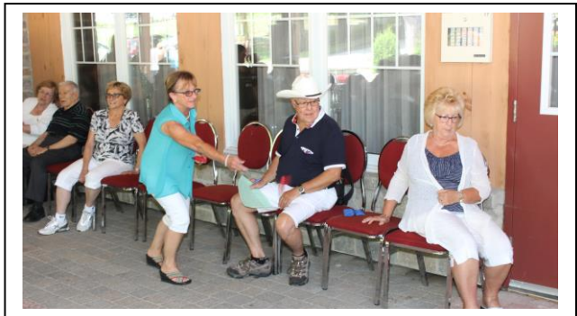
Tournoi de pétanques