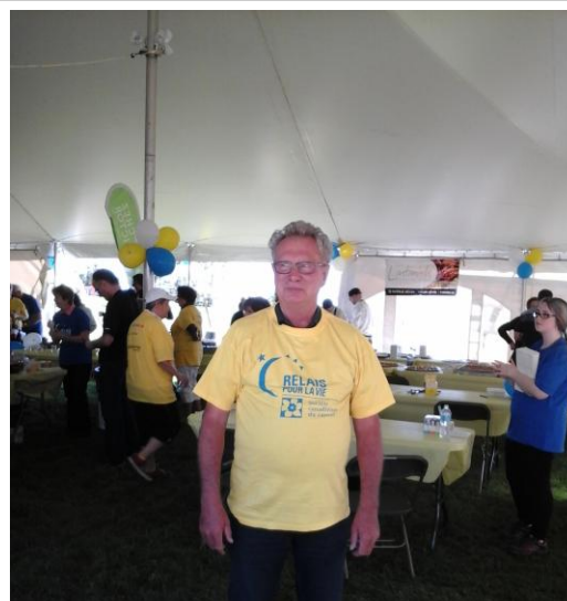
Remise du chandail jaune pour les survivants