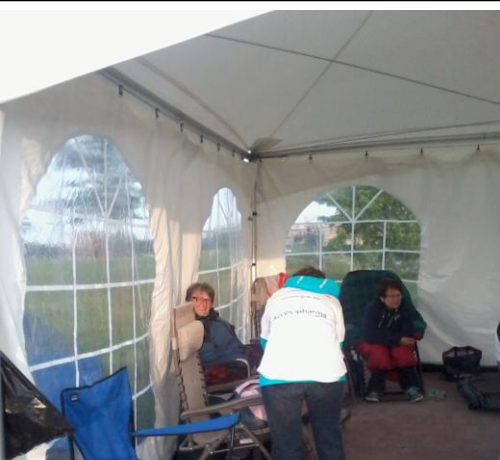
Il y en a qui ont besoin de se réchauffer car il faisait froid (8 degré C.).