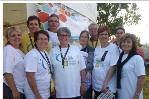
Le groupe initial des 10 participants + 1 bébé.