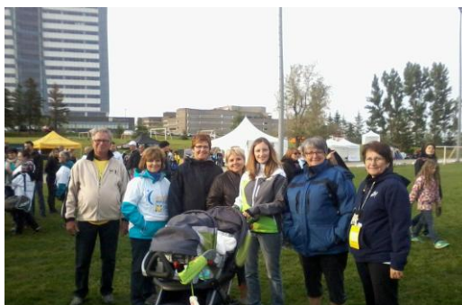
Groupe restant à la fin de la marche. Le bébé est encore là.