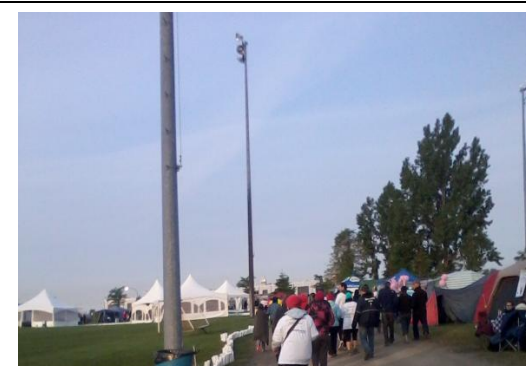
Marche des participants vers la fin du relais.